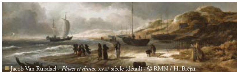
■ Jacob Van Ruisdael - Plages et dunes , XVII e siècle (détail) - © RMN / H. Bréjat

La collection du duc d'Aumale conserve en effet plus de quatre-vingts dessins et seize tableaux, tous du XVI e -XVII e siècle, le Siècle d'Or hollandais, d'une très grande qualité. Un certain nombre de ces œuvres a été acquis en Hollande au XVII e siècle par le Grand Condé lui-même, cousin du roi Louis XIV et propriétaire de Chantilly au XVII e siècle.