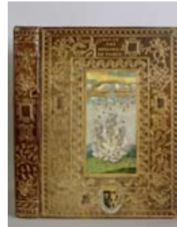
■ Reliure: « De l'Estade et succès des affaires de France... » de Bernard de Girard, seigneur du Haillan