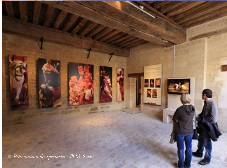
■ Présentation des spectacles