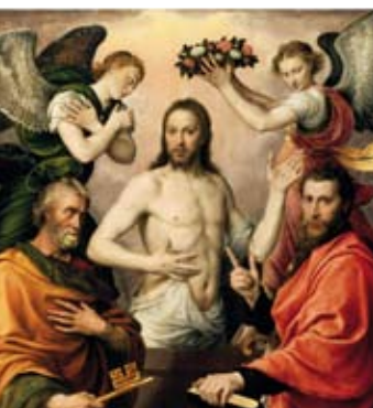
■ Anthonis Moor Jésus-Christ ressuscité entouré de saint Pierre, saint Paul et deux anges, XVI e siècle Chantilly, musée Condé