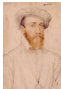
■ François de Coligny, seigneur d'Andelot, xvr e siècle