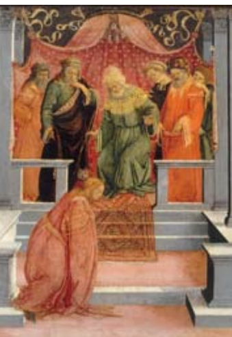
■ Lippi Filippino

Esther choisie par Assuérus , 1480 (détail)