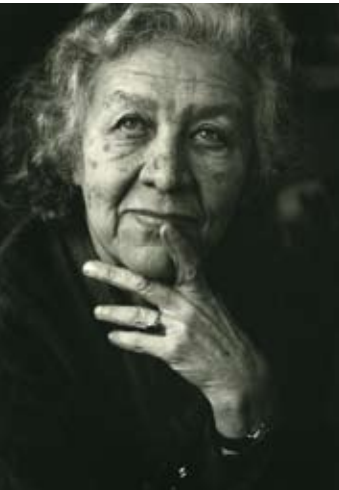
■ Jacqueline de Romilly (02 02 1984)