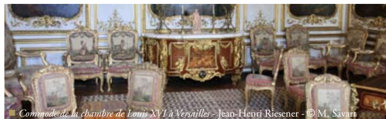
■ Commode de la chambre de Louis XVI à Versailles - Jean-Henri Riesener

Des visites thématiques autour de ces chefs-d'œuvre sont organisées les dimanches. Cf. page 17.