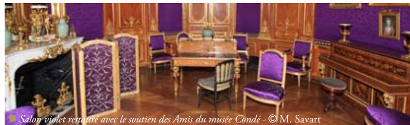
■ Salon violet restauré avec le soutien des Amis du musée Condé

Dimanche 7 novembre 2010, 15h30. Théâtre de la faisanderie, Potager des princes