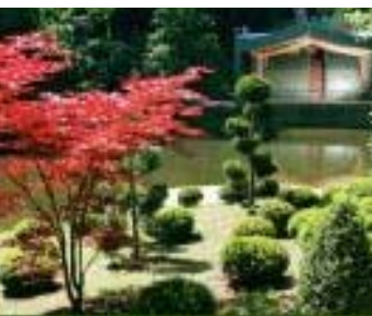
■ Le Potager des Princes