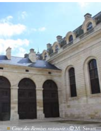
■ Cour des Remises restaurée