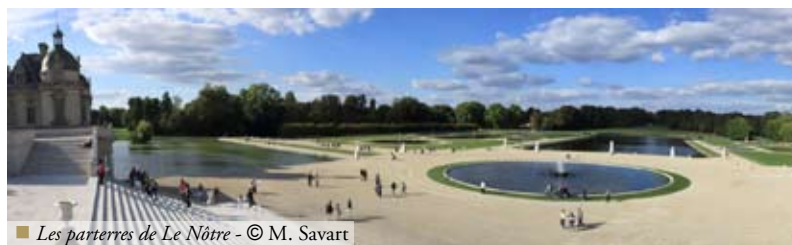
■ Les parterres de Le Nôtre