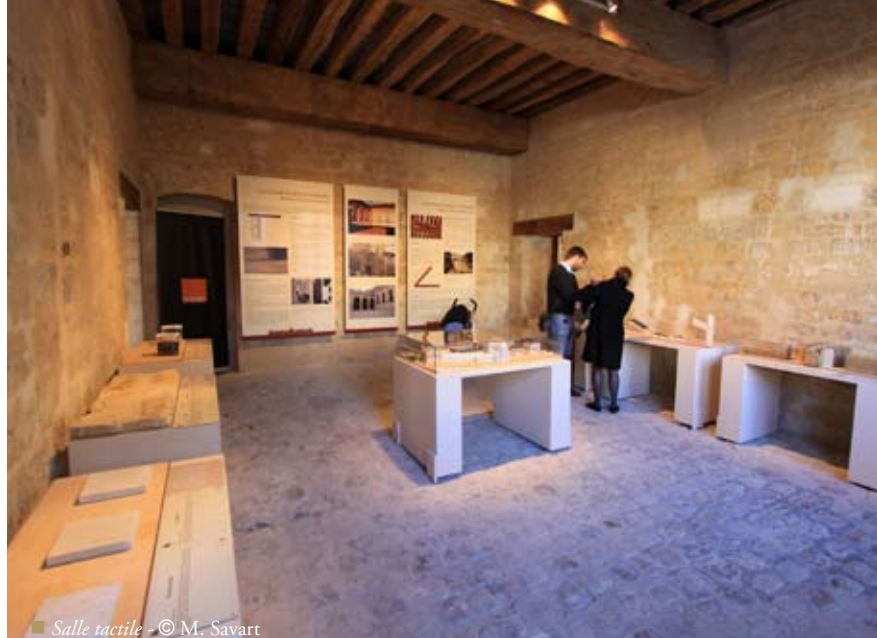
■ Salle tactile

Pour visiter ces nouvelles installations: Après 15h30, billet unique: 4 €/ adulte. Gratuit pour les enfants.