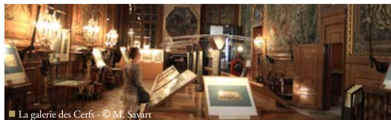
■ La galerie des Cerfs

Pour prolonger votre visite, découvrez les panneaux de cassoni du musée de la Renaissance au château d'Écouen.